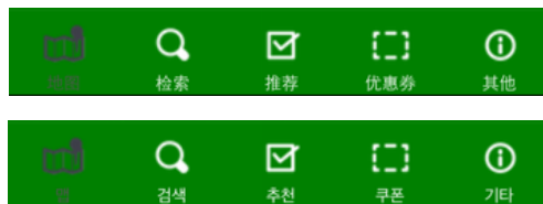
メニューボタン拡大図 (上) 中国語簡体字 (下) 韓国語